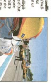
Rien ne sert de courir, il faut partir à point... Le directeur du « Ricard » suit de près les candidatures et les raisons qui poussent à franchir ou à ne pas franchir le pas.

Trois sites sont candidats pour accueillir l'événement : l'île de la Moutonne (Vendôme), le Val-de-France (Sardelles, Val d'Isère), ou tout est à construire, et un Magny-Cours 2. Il y a cependant, dans les deux autres sites, des avantages et des inconvénients. Par exemple, le site de l'île de la Moutonne est très proche de la mer, ce qui est un avantage pour la sécurité des pilotes. Mais, d'un autre côté, le site de l'île de la Moutonne est très éloigné de la région PACA, ce qui est un inconvénient pour les fans.