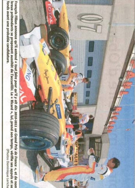
François Fillon annonce qu'il entend « tout faire pour qu'il y ait dès 2010-2011 un Grand Prix de France », et de nombreux autres élus de l'Assemblée de la Région PACA ont pris le parti de soutenir un tel projet.