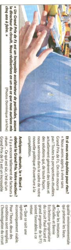
« Un Grand Prix de F1 est un incroyable accélérateur de parties, assure le directeur du circuit. Nous réalisons en un an ce que nous aurions mis cinq ans à faire. »

« alterner entre le "ricard" et magny-cours »