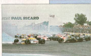
Circuit PAUL RICARD

souhaitons préserver son ADN : la compétition, le souci de l'environnement et surtout ce cadre familial et de proximité que voulait Paul Ricard. Je veux que l'on puisse passer un dimanche au circuit comme un dimanche à la campagne, en famille, pour pas cher, comme une promenade à travers la pinède, les aires de pique-nique et de jeux aménagés