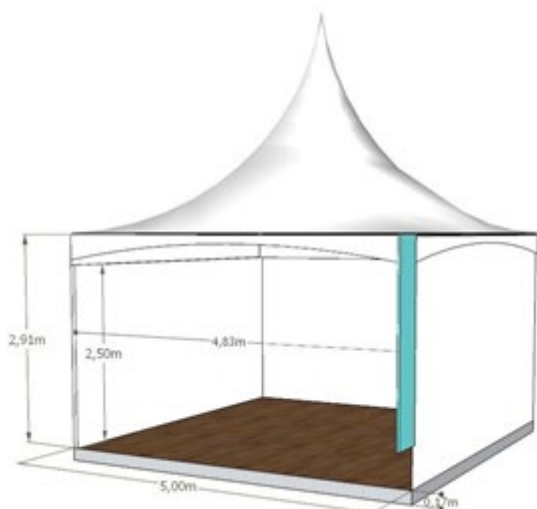
Photo d'illustration de l'implantation des tentes au P2